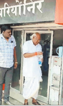
सुविधा होगी। उन्होंने अधिकारियों को निर्देश दिए कि समय-समय पर वाटर एटीएम की सफाई और गुणवत्ता जांच की व्यवस्था सुनिश्चित की जाए ताकि ग्रामीणों को लगातार शुद्ध पेयजल मिलता रहे।

सांसद चिंतामणि महाराज ने नगर में पेयजल आपूर्ति स्थिति का जायजा लिया। इस दौरान उन्होंने ग्राम पंचायत बरियों में वाटर एटीएम बरियों नीर का निरीक्षण किया जिसके माध्यम से ग्रामीणों, राहगीरों को शुद्ध और ठंडा पेयजल निःशुल्क उपलब्ध कराया जा रहा है। उन्होंने वाटर एटीएम से स्वयं बोतल में ठंडा पानी भरकर पानी भी पिया। इस दौरान उन्होंने उपस्थित अधिकारियों से जल आपूर्ति की नियमितता और गुणवत्ता के बारे में भी जानकारी ली। सांसद श्री महाराज ने कहा कि गर्मी के मौसम में स्वच्छ और ठंडे पानी की आवश्यकता अधिक होती है। इसके लिए बरियों नीर जैसी पहल से ग्रामीण जनों को काफी सुविधा होगी। उन्होंने अधिकारियों को निर्देश दिए कि समय-समय पर वाटर एटीएम की सफाई और गुणवत्ता जांच की व्यवस्था सुनिश्चित की जाए ताकि ग्रामीणों को लगातार शुद्ध पेयजल मिलता रहे।