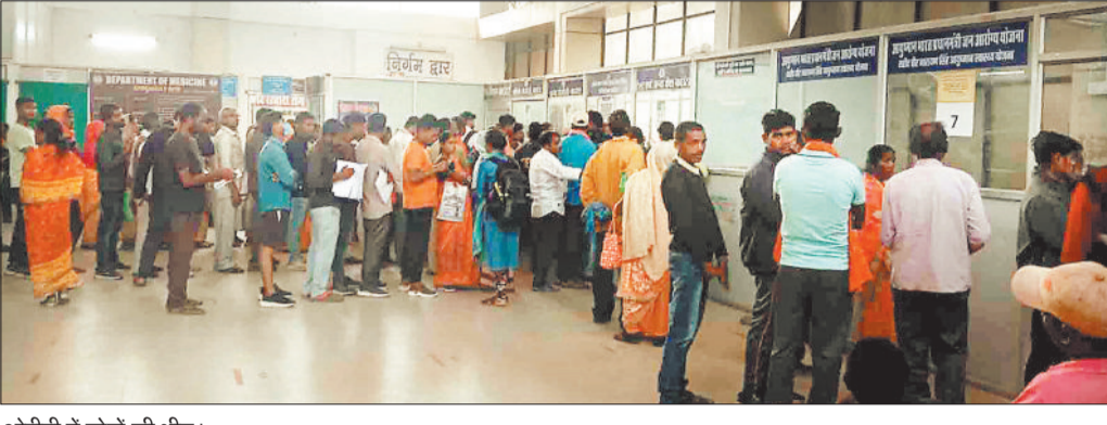
ओपीडी में लोगों की भीड़।

मेडिकल कॉलेज अस्पताल में कुछ दिनों से मरीजों की संख्या काफी बढ़ गई है जिससे हर रोज ओपीडी में भी मरीज के परिजन की भीड़ बढ़ने लगी है। ओपीडी में शहर की अपेक्षा ग्रामीण क्षेत्र के लोगों की ज्यादा भीड़ होती है जो मौसमी बीमारी का इलाज करने पहुंचते हैं। चिकित्सकों के मुताबिक हुई बारिश के बाद अचानक तापमान में वृद्धि होने तथा गर्मी व उमस बढ़ जाने से इसका विपरीत असर लोगों के स्वास्थ्य पर पड़ रहा है। ऐसे में छोटे से लेकर बड़े भी मौसम के अचानक बदल जाने से सर्दी, खांसी व बुखार के अलावा उल्टी-दस्त से पीड़ित होने लगे। इन दिनों मेडिकल कॉलेज अस्पताल के अलावा निजी अस्पतालों में भी मरीजों की संख्या बढ़ने लगी है। मेडिकल कॉलेज अस्पताल के ओपीडी में कुछ दिनों से मरीजों की संख्या वृद्धि हुई है हालांकि ओपीडी में विभिन्न बीमारियों की जांच कराने लोग आते हैं परंतु उनमें अधिकांश लोग मौसमी बीमारी से पीड़ित होते हैं। इस